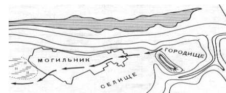
Рис. 4 Чаплинский могильник “на путях” из городища.

И еще: Могильники ставили перед входом в поселение, в чем был особый смысл(!). Рыбаков о летописи Нестора: “Невольно вспоминается фраза летописца о том, что славяне-язычники после сожжения покойника ставили урну с прахом в домовину “на путях”. Здесь действительно путь в поселок вел мимо селения умерших предков или даже через кладбище: на плане ощущается идущая от въезда вдоль берега неширокая полоса, не занятая могилами; она и могла быть древней дорогой из городища, тем “путем”, по сторонам которого располагались домовины умерших “дядов””.